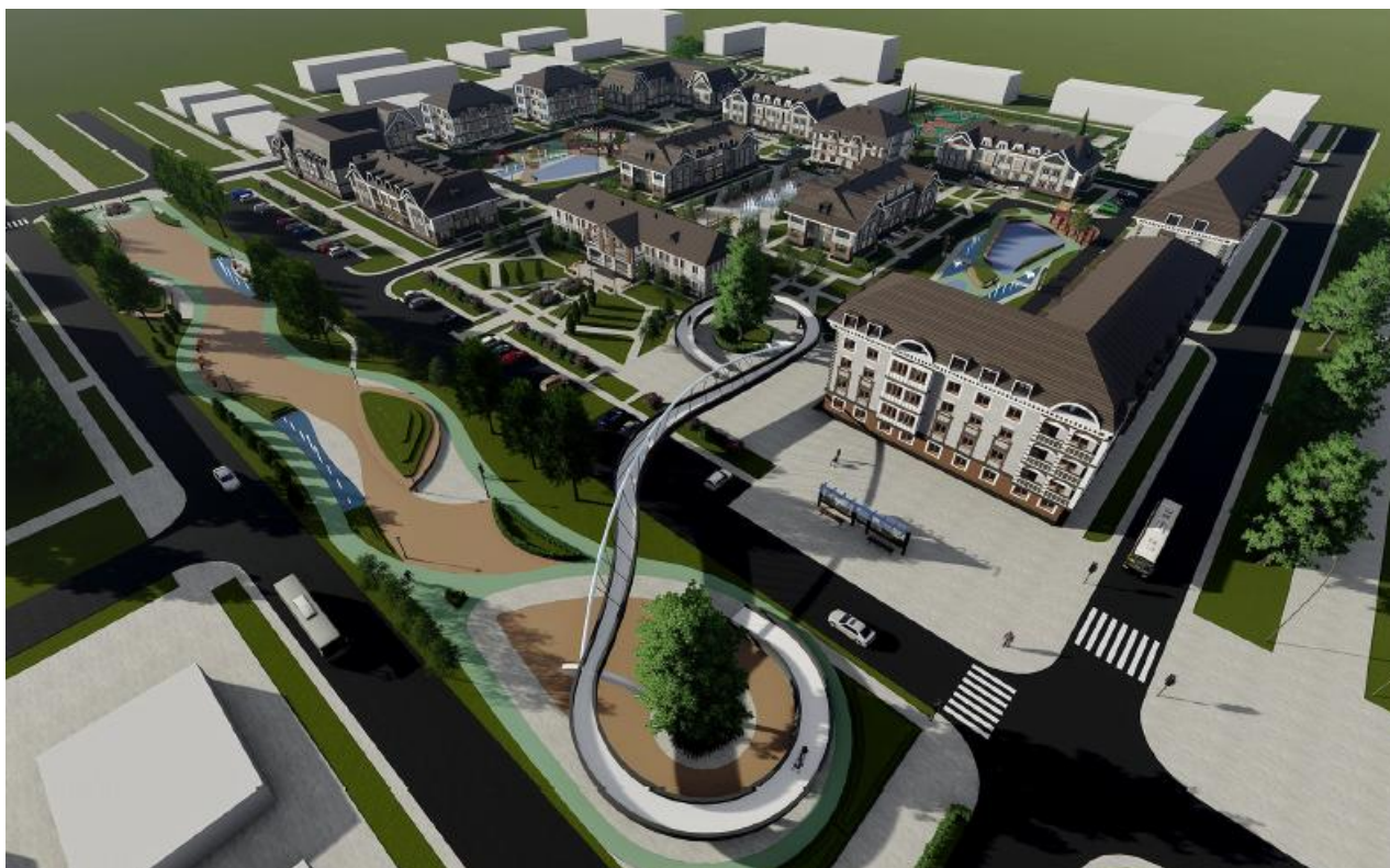
Рисунок 3. Объемно-пространственное решение участка реконструкции

Иллюстрации каждого приложения обозначают отдельной нумерацией арабскими цифрами с добавлением перед цифрой обозначения приложения, например: Рисунок Б.2.